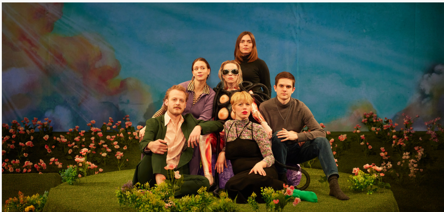
How to Kill a Dog