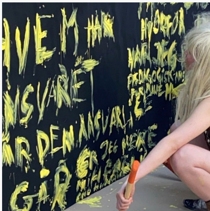
Persona Non Grata

Historisk har der altid eksisteret teatergrupper i Danmark, der har organiseret sig politisk og med deres scenekunst prøvet at ændre alt fra arbejdsvilkår til politisk overbevisning. I 1925 var det Arbejdernes Teater, et kooperativt, socialdemokratisk teater, hvis mål var at skabe et teater for, med og af arbejdere [19]. Senere kom den kommunistiske agitprop gruppe RT, Revolutionært Teater [20] og med 68-oprøret kom teatergrupper som Solvognen, der udsprang fra Christiania, med forestillinger og aktioner i byen om alt fra Nato til arbejdsret.