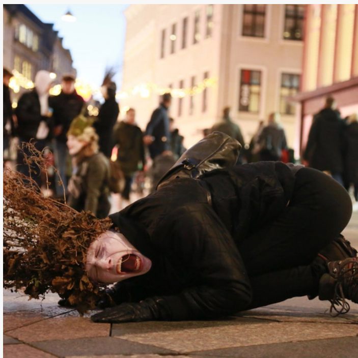
Becoming Species - Black Friday Aktion 2020 Strøget København.

Becoming Species består af 10-15 forskellige arter, der forbinder globale klimastemmer og opråb fra truede arter, med lokal kunstnerisk udforskning. De indtager det offentlige rum for at sætte fokus på sammensmeltningen mellem samfund og natur.