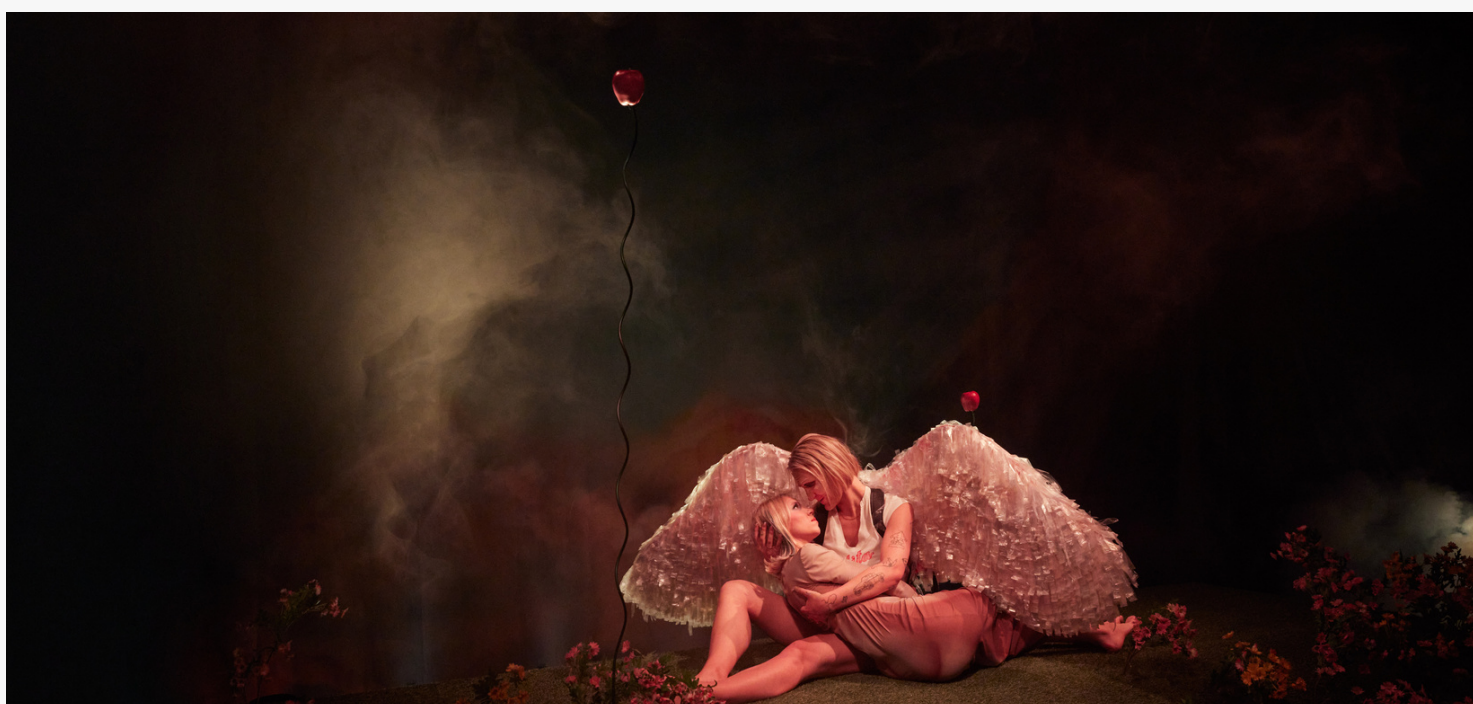
How to Kill a Dog